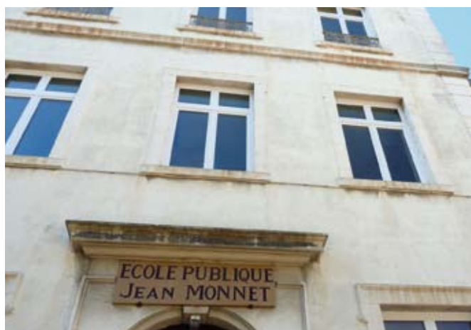
Élémentaire Jean-Monnet : aménagement d'une classe, d'une salle des maîtres et création d'un escalier (120 000 €).