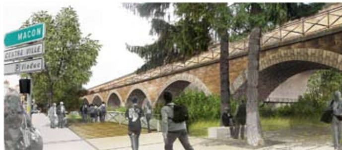
Coût des aménagements de voirie : 800 k€

Cette phase transitoire durera jusqu'en mars 2011 avant que les installations définitives ne soient mises en place avec une mise en lumière des Viaducs, la réorganisation paysagère du parking et une mise en valeur des berges du Morgon par une passerelle et de nouveaux cheminements.