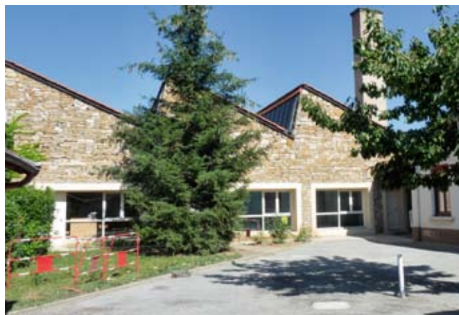
Maternelle Camille-Claudel : galerie couverte reliant les 2 bâtiments et création de nouveaux sanitaires (45 000 €).