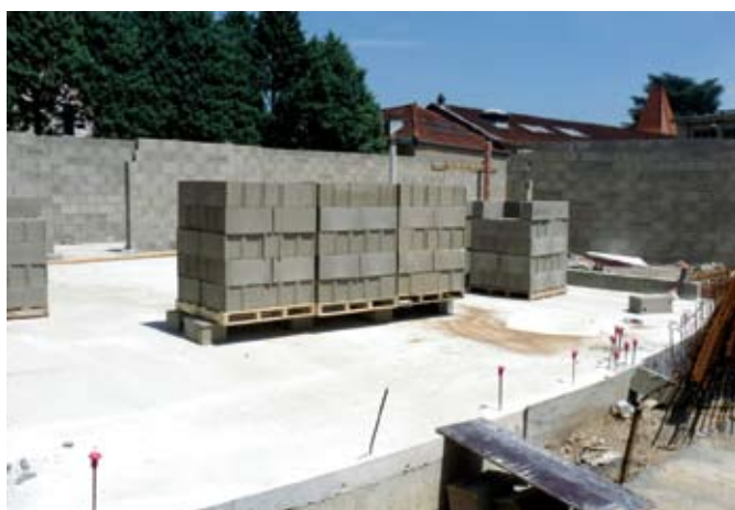
Maternelle Lamartine : agrandissement de l'école : salles de classes, locaux administratifs, sanitaires, couchettes (350 000 € pour la 1 re tranche 2010).