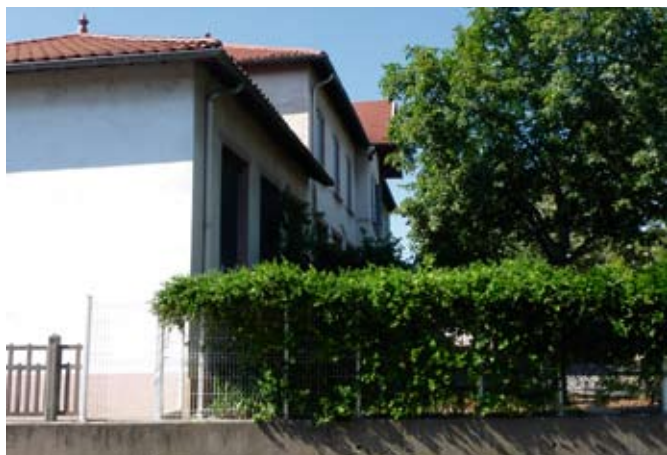
Maternelle Condorcet : aménagement d'une classe à l'étage et d'un escalier (70 000 €).

Voici les principaux travaux réalisés cette année dans les établissements scolaires, dont une partie durant l'été.