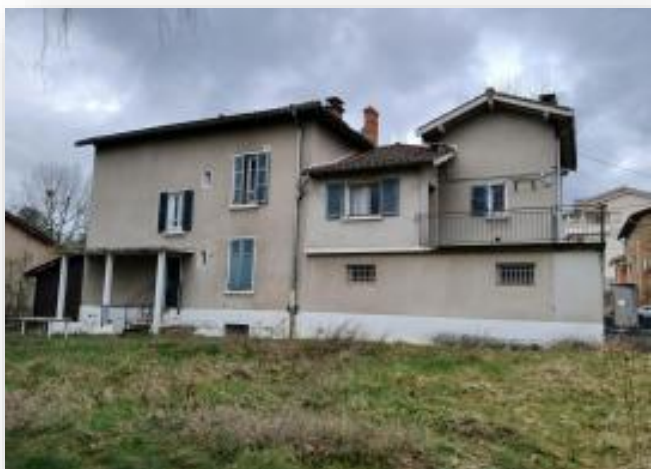
Façade depuis le terrain de la propriété